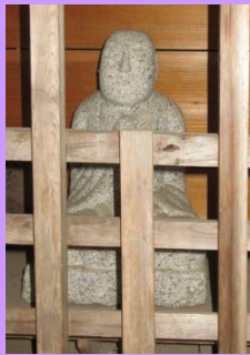
第37番 弘法大師坐像 「八天堂」