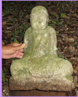
第38番 弘法大師坐像 裏山に39番と並んで