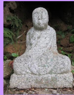
第41番 弘法大師坐像 住宅裏庭の石垣祠