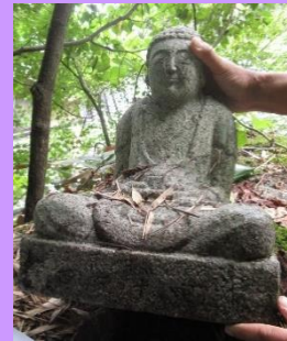
第43番 釈迦如来坐像 住宅裏庭の巨石上