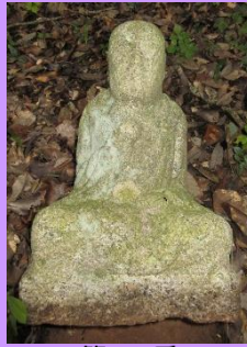
第39番 弘法大師坐像 裏山に38番と並んで