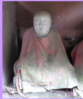
第40番 弘法大師坐像 道路端の祠