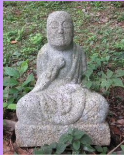
第36番 弘法大師坐像 裏山の斜面