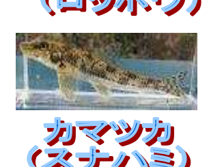
カマツカ (スナハマ)