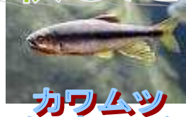
カワムツ (アカマチ)