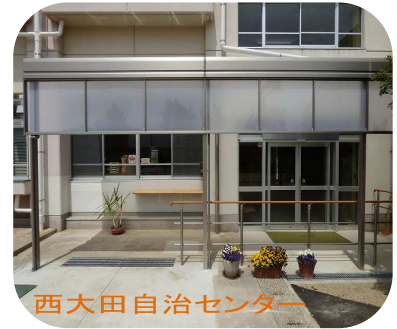
西大田自治センター